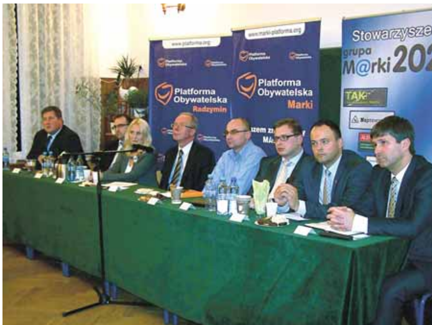
Wojewoda podczas spotkania z mieszkańcami Marek w sprawie obwodnicy.