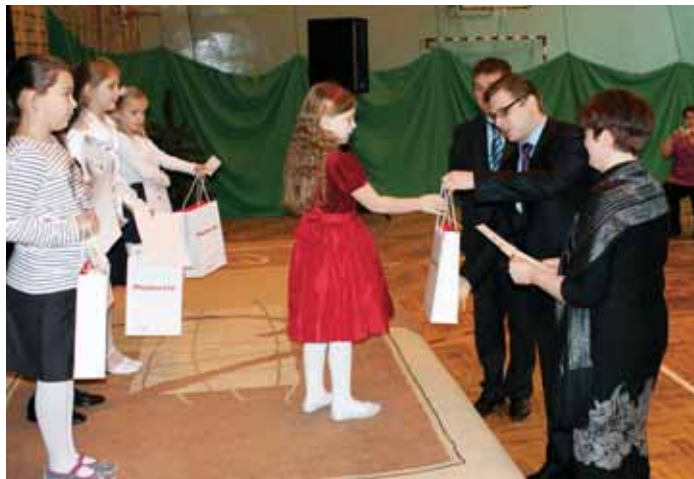
Fot. Tomasz Sierafski